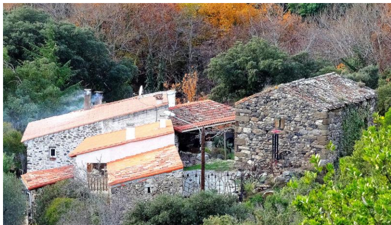
La chapelle Saint Julià en bas à droite

Située au sommet d'un rocher qui domine la rivière de quelques mètres, on peut voir une petite tour carrée réduite à un rez-de-chaussée. C'est tout ce qui reste du château des Albas , si du moins il y eut autre chose, dont, par ailleurs on ne sait rien, ni ce qu'il défendait, ni à quoi il pouvait servir étant placé trop bas pour communiquer avec les tours à signaux du Fenollède ou avec ses voisins.