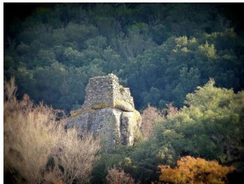
Les ruines du château des Albas

Au confluent de la Desix et de la Matassa dont les bords sont plantés de peupliers existent les ruines du château des Albas daté du XI e ou XII e siècle et de sa chapelle ( Saint-Julien ).