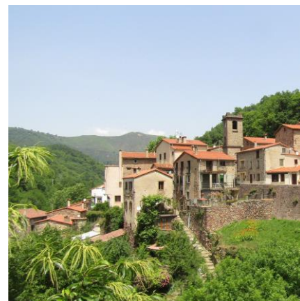
Le village de Lamanère et l'église St-Sauveur

Départ : 8 h 15 au parking de la piscine du Moulin à Vent à Perpignan