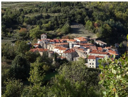
le village de Vira