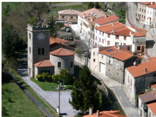
La nouvelle église du Vivier

L'église actuelle, également dédiée à Sainte-Eulalie, construite dans le village bas, a été consacrée le 9 décembre 1954.