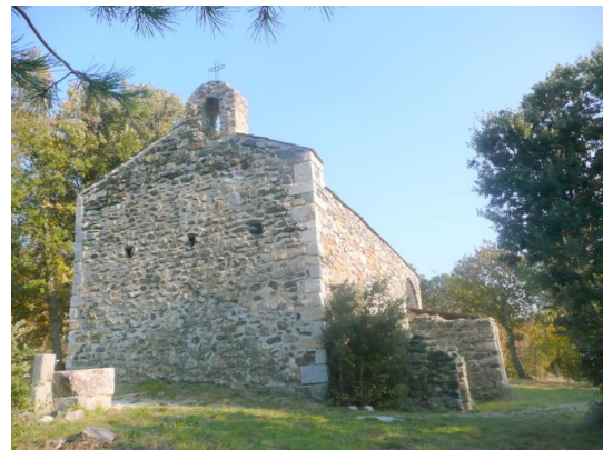
L'ancienne chapelle du village Sainte-Eulalie

Les villageois ont occupé trois lieux sur trois périodes distinctes : au X e siècle proche de la chapelle Sainte-Eulalie au nord de la rivière Matassa, puis autour du château le village haut « la ville » au XII e s, et enfin dans la vallée au nord-est du château le village bas, « le barry ». Une installation qui se fit toujours à proximité de la Matassa provenant de la forêt de Boucheville et rejoignant la Desix aux Albas.