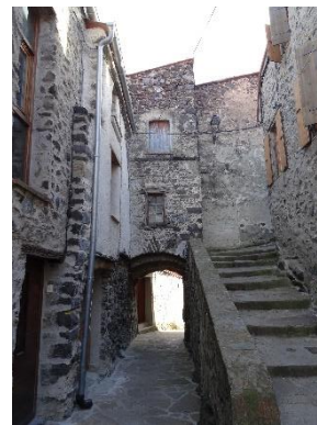
le passage voûté

Prochaine Sortie : le 12 2 2023 le sentier du douanier Banyuls sur Mer Pour se renseigner, tél à : Jean-François 04 68 56 81 03 / 06 20 40 63 05